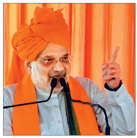
लला के अपमान से नहीं जोड़े. अपाकी सरकार में राम लला टेंट में थे, लेकिन मोदी जी ने भूमि पूजन भी किया और मंदिर भी बनाया।

एजेसी ► गुरुग्राम शाह ने कहा कि मैं आपसे कहना चाहता हूँ कि अपने बेटों को सेना में भेजने से पहले संकोच ना करें। हर अग्निवीर को पेंशन वाली नौकरी मिलेगी। हरियाणा वो प्रदेश है, जहाँ का हर दसवाँ जवान सेना में जाता है। मोदी जी ने वादा किया था कि हम वन रैंक वन पेंशन को पूरा करेंगे। 40 साल से कांग्रेस की तीन पीढ़ियों ने सेना का सम्मान नहीं किया। वन रैंक वन पेंशन को पूरा नहीं किया। वन रैंक वन पेंशन का तीसरा वर्जन भी मोदी जी ने लागू कर दिया। अब नई तनख्वाह के साथ पेंशन मिलने वाली है। हरियाणा की माँ अपने सपूतों को सेना में भेजने से मत झिझकिएगा। मैं आज बादशाहपुर में कहकर जाता हूँ कि पांच साल बाद कोई ऐसा अग्निवीर नहीं होगा, जिसके पास नौकरी नहीं होगी और पेंशन नहीं होगा। ये लोग तुष्टिकरण में अंधे हुए हैं। अयोध्या में राम मंदिर बनाया चाहिए था या नहीं। वो कहते हैं कि हमने अयोध्या के विचार को हरा दिया। राहुल बाबा सीटों पर हार जाते तो होती रहती है। आप उसको राम