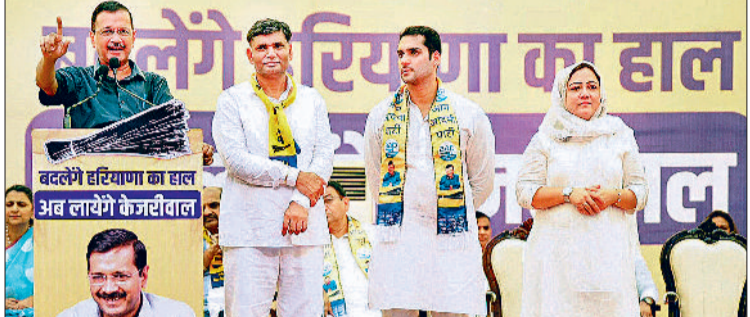
एजेसी ►► बादशाहपुर

गृह मंत्री अमित शाह अग्निवीर योजना को लेकर भी कांग्रेस को जवाब दिया। उन्होंने कहा, “अग्निवीर योजना सिर्फ जवानों का जवान बनने के लिए लाई गई है। हरियाणा के एक-एक अग्निवीर को राज्य सरकार और भारत सरकार पेंशन वाली नौकरी देगी। पांच साल के बाद कोई अग्निवीर ऐसा नहीं होगा, जिसका पास पेंशन वाली नौकरी नहीं होगी। गृह मंत्री शाह बीते 10 साल के कार्यकाल का हिसाब भी दिया। उन्होंने कहा, “यूपीए सरकार ने हरियाणा को 41 हजार करोड़ रुपये दिए थे, जबकि मोदी सरकार ने बीते 10 सालों में हरियाणा को 2 लाख 92 हजार करोड़ रुपये दिया। पीएम मोदी को सबसे ज्यादा प्यार हरियाणा से है।”