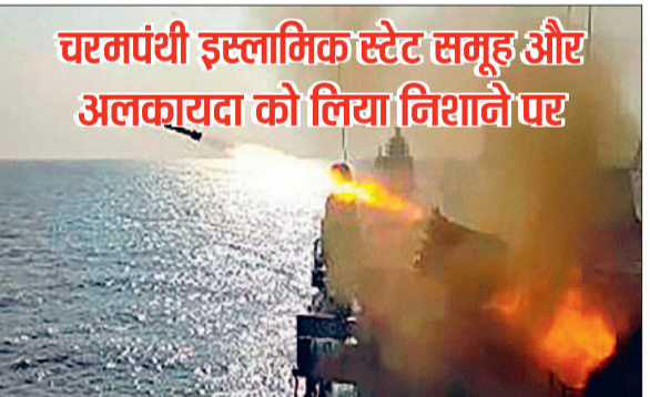
चरमपंथी इस्लामिक स्टेट समूह और अलकायदा को लिया निशाने पर